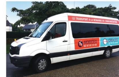
Créacéo est un service de transport à la demande qui vient en complément des lignes régulières urbaines et périurbaines

Les conditions ? Payer un ticket de bus classique et réserver une demi-journée à l'avance.