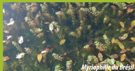
Myriophille du Brésil

Myriophille du Brésil , Jussies , Elodée , Bident feuillé , griffes de sorcières , Crassule de Helm , Lagarosiphon , Rhododendron pontique , Séneçon cinéraire , Spartine à feuilles alternes , Balsamine de l'Himalaya , Paspale distique . . .