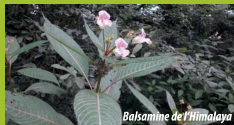
Balsamine de l'Himalaya