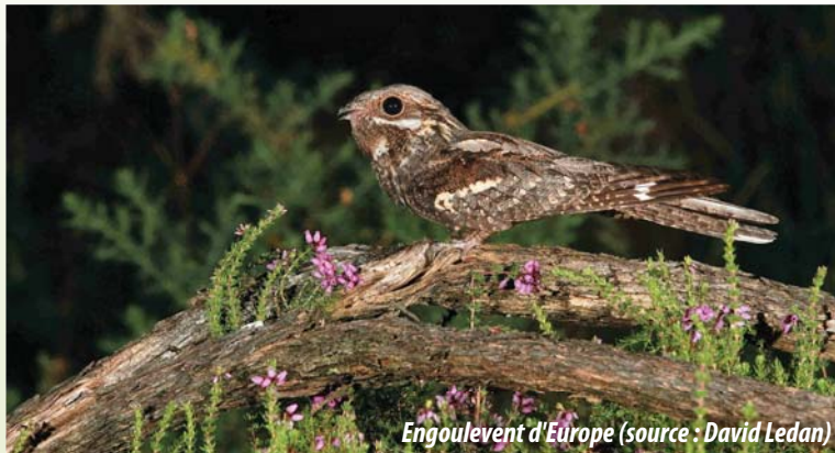
Engoulevent d'Europe

Il se reproduit en Europe et Asie et hiverne en Afrique.