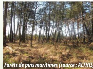
Forêts de pins maritimes