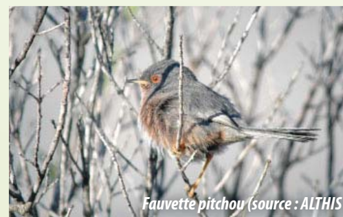
Fauvette pitchou

Le maintien de l'engoulement d'Europe sur la commune est lié au maintien d'habitats de landes et de boisement semi-ouvert. Ces milieux sont également importants pour d'autres espèces d'oiseaux protégées présentes sur la commune telles que la Fauvette pitchou et la Linotte mélodieuse